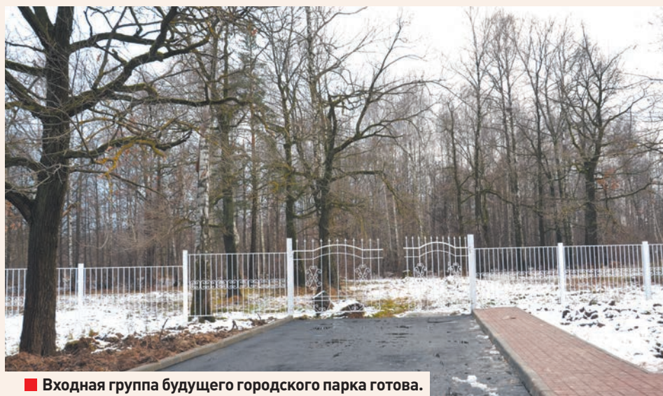
■ Входная группа будущего городского парка готова.