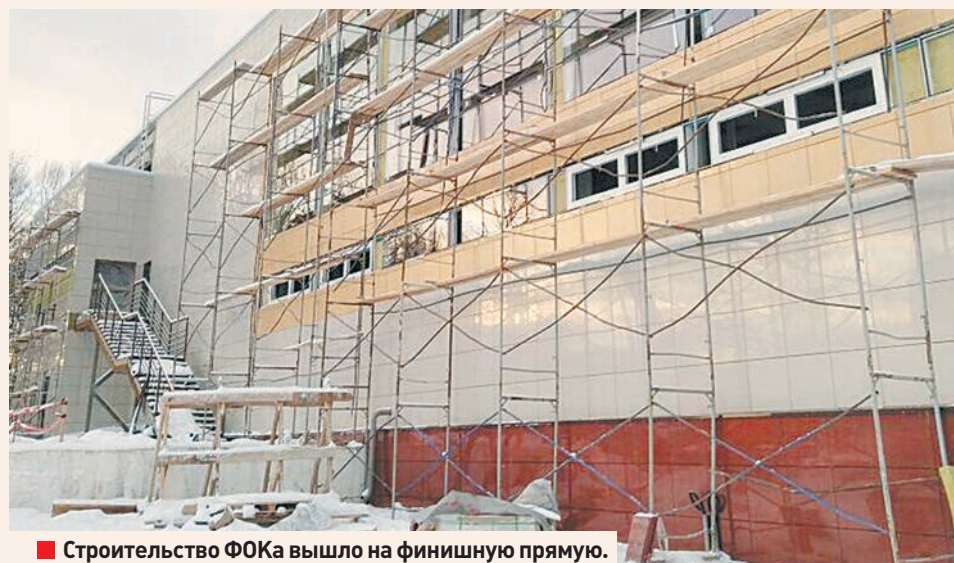
■ Строительство ФОКа вышло на финишную прямую.