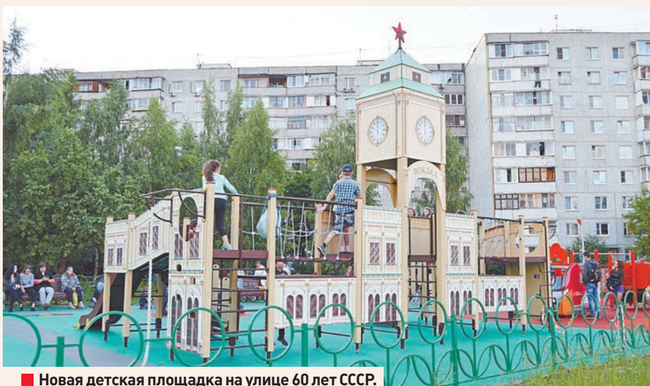
■ Новая детская площадка на улице 60 лет СССР.