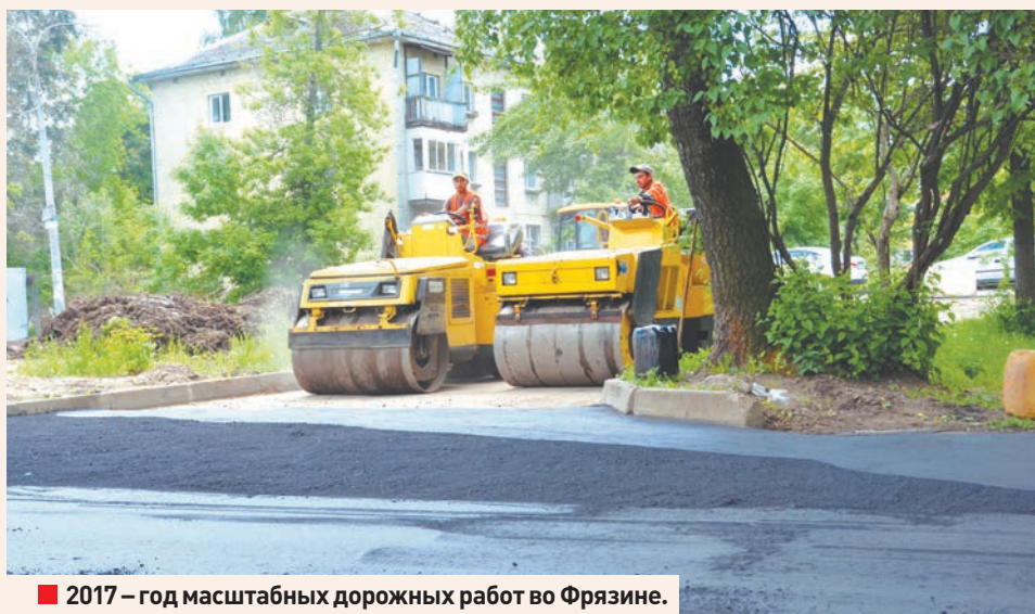
■ 2017 – год масштабных дорожных работ во Фрязине.