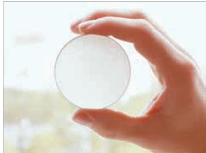
● Пластина поликристаллического CVD-алмаза.