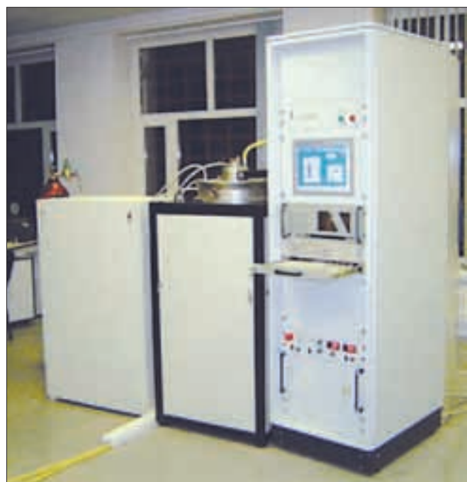
● Установка синтеза алмазных пленок в СВЧ-плазме УПСА-100.