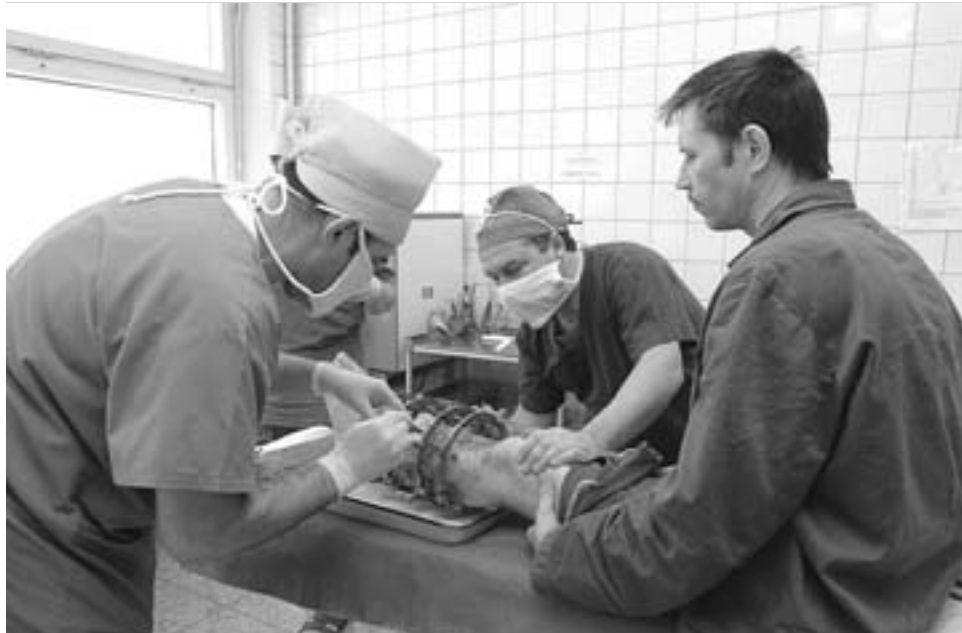
Подмосковным медикам не привыкать к большому нагрузкам...

Но у нас накоплен опыт по освоению больших объемов средств при непрекращающемся процессе оказания медицинской помощи, то есть в режиме текущей работы учрежденный здравоохранения. Устанавливать оборудование в таких условиях относительно просто, а вот проводить капитальный ремонт в действующих ЛПУ – проблематично. Но, повторю, такой опыт у нас есть, например, в МОНКИ им. М.Ф.Владимирского, Московском областном научно-исследовательском институте акушерства и гинекологии, областном госпитале ветеранов войн, об-