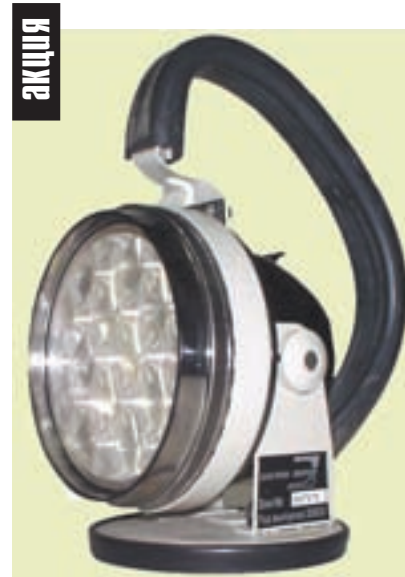
● Фара ручная светодиодная ФР-ВС «ЭКОТОН-3».