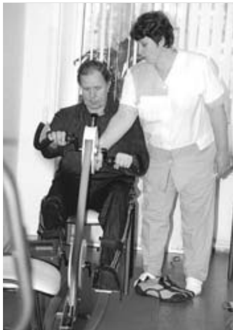
При многих центрах работают кабинеты лечебной физкультуры.

Работа центров не является чем-то застывшим. По мере их функционирования день ото дня появляется что-то новое. Сегодня в регионе идет об-