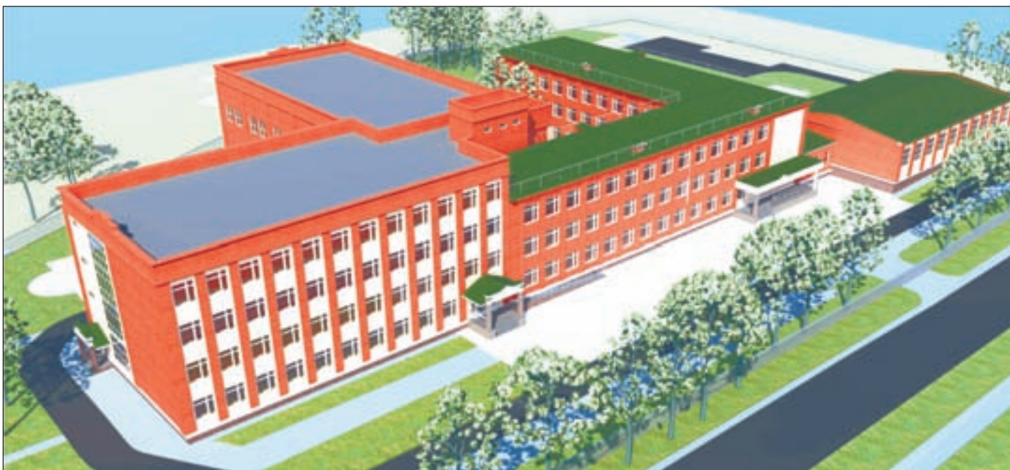
● На территории школы №3 появится новый, соответствующий XXI веку учебный комплекс.