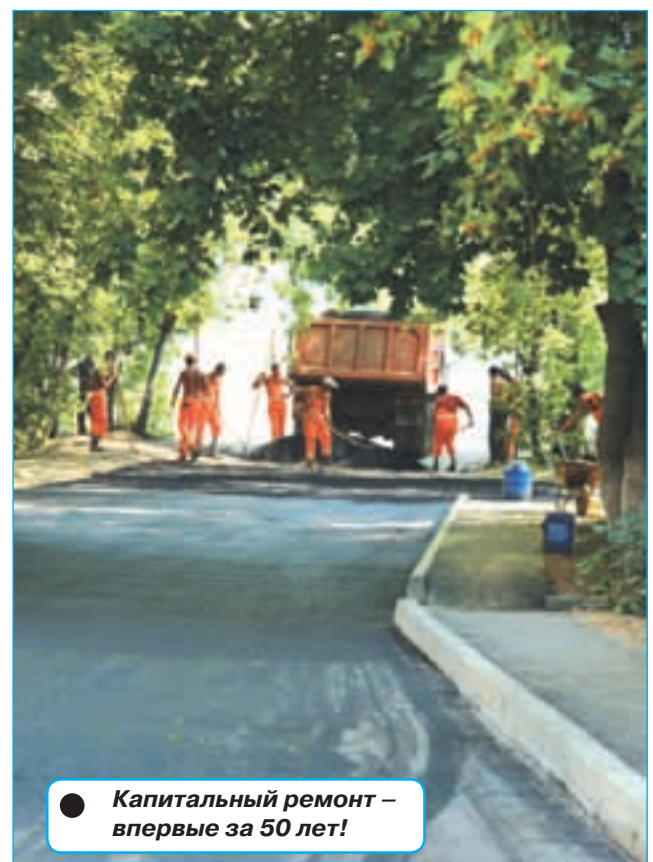
● Капитальный ремонт – впервые за 50 лет!