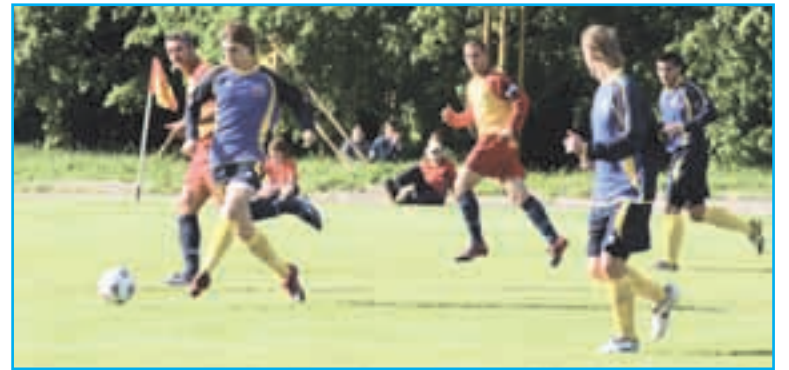
Фото: в атаке – фрязинский «Олимп», автор фотографий – Андрей КИРЮХИН.