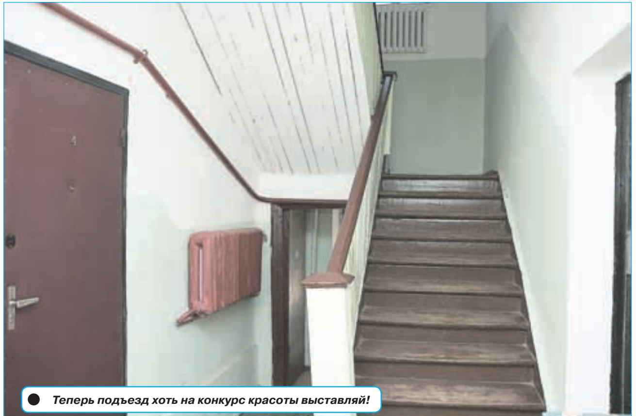
● Теперь подъезд хоть на конкурс красоты выставляй!