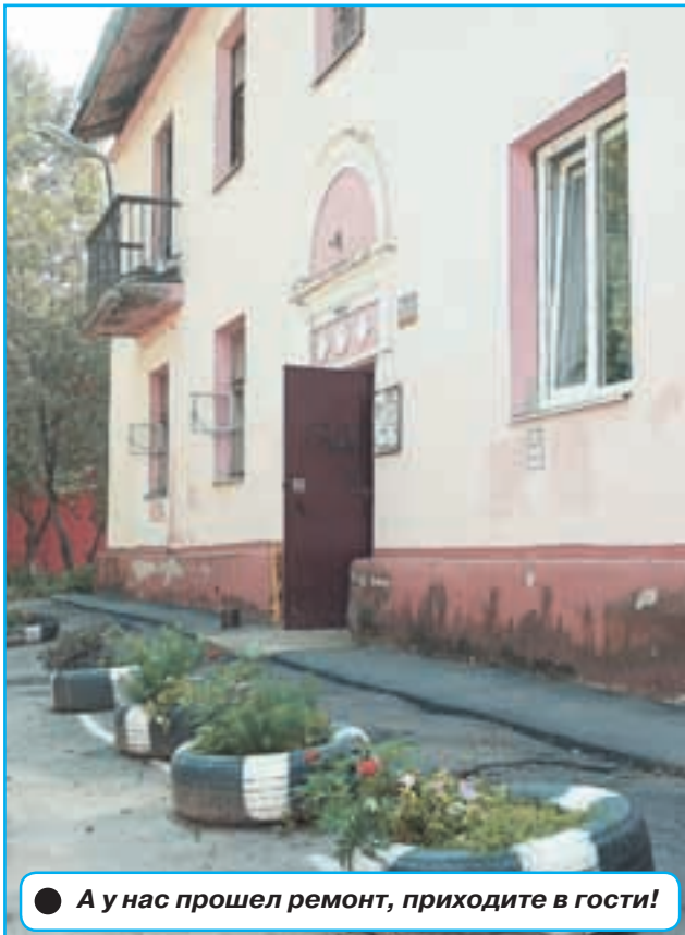
● А у нас прошел ремонт, приходите в гости!