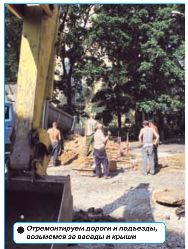
● Отремнтируем дороги и подъезды, возьмемся за васады и крыши