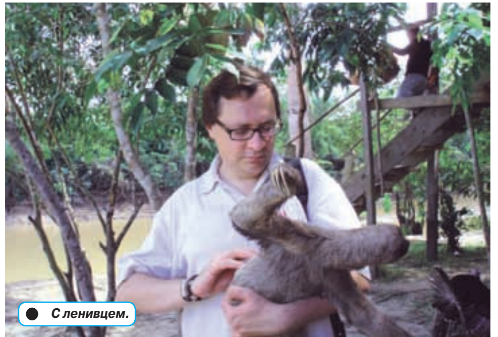
● С ленивцем.