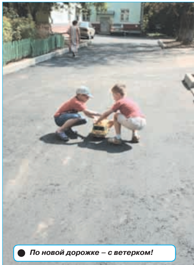
● По новой дорожке – с ветерком!