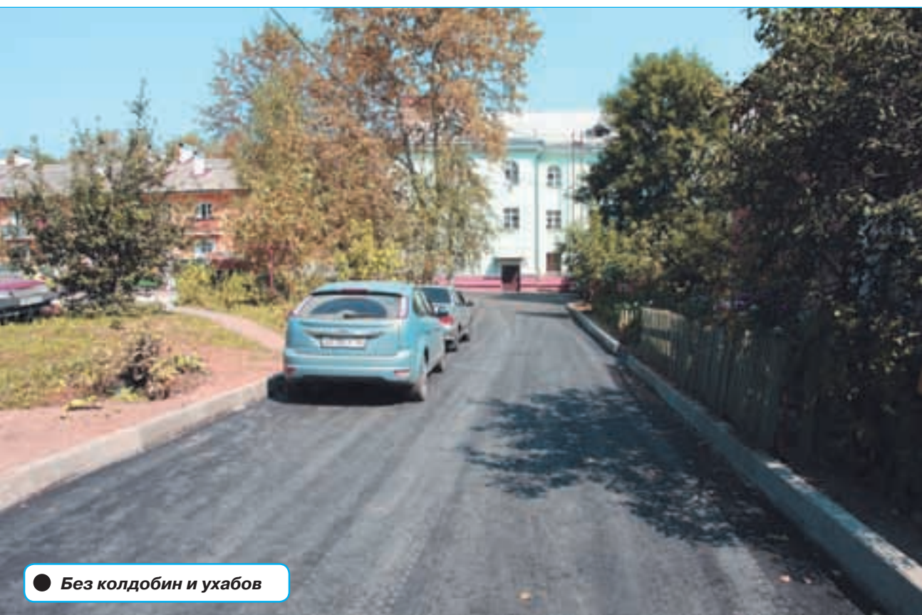
● Без колдобин и ухабов