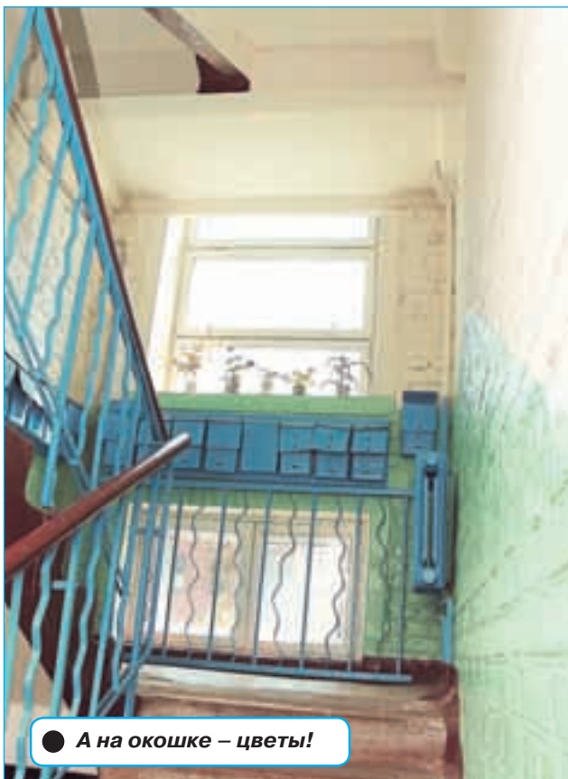
● А на окошке – цветы!