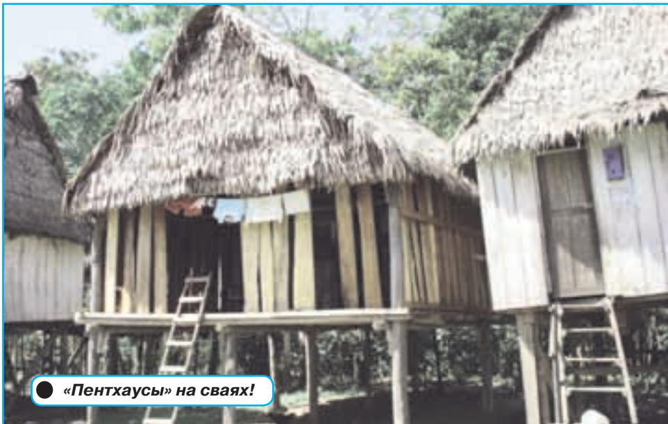
● «Пентхаусы» на сваях!

Перед полетом в Перу я посмотрел, что пишут об этой стране в Интернете. Нашел там много восторженных откликов, с одним из которых я полностью согласен: «Несмотря на природные и экономические трудности и сравнительно невысокий общий уровень жизни, здесь умеют жить со вкусом! Потомки инков и идалго отличаются искренним гостеприимством, душевной щедростью и врожденным достоинством, которые так гармонизируют с окружающей природой! Они словно знают, где лежат ключи от рая на Земле...».