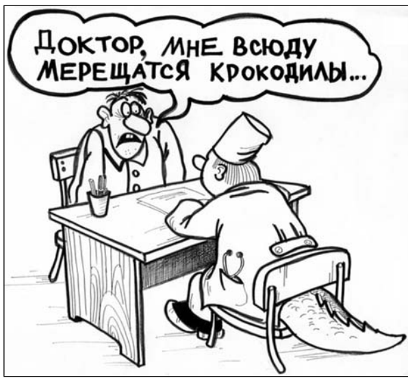
Андрей Абрамов, карикатура «У доктора». http://caricatura.ru/