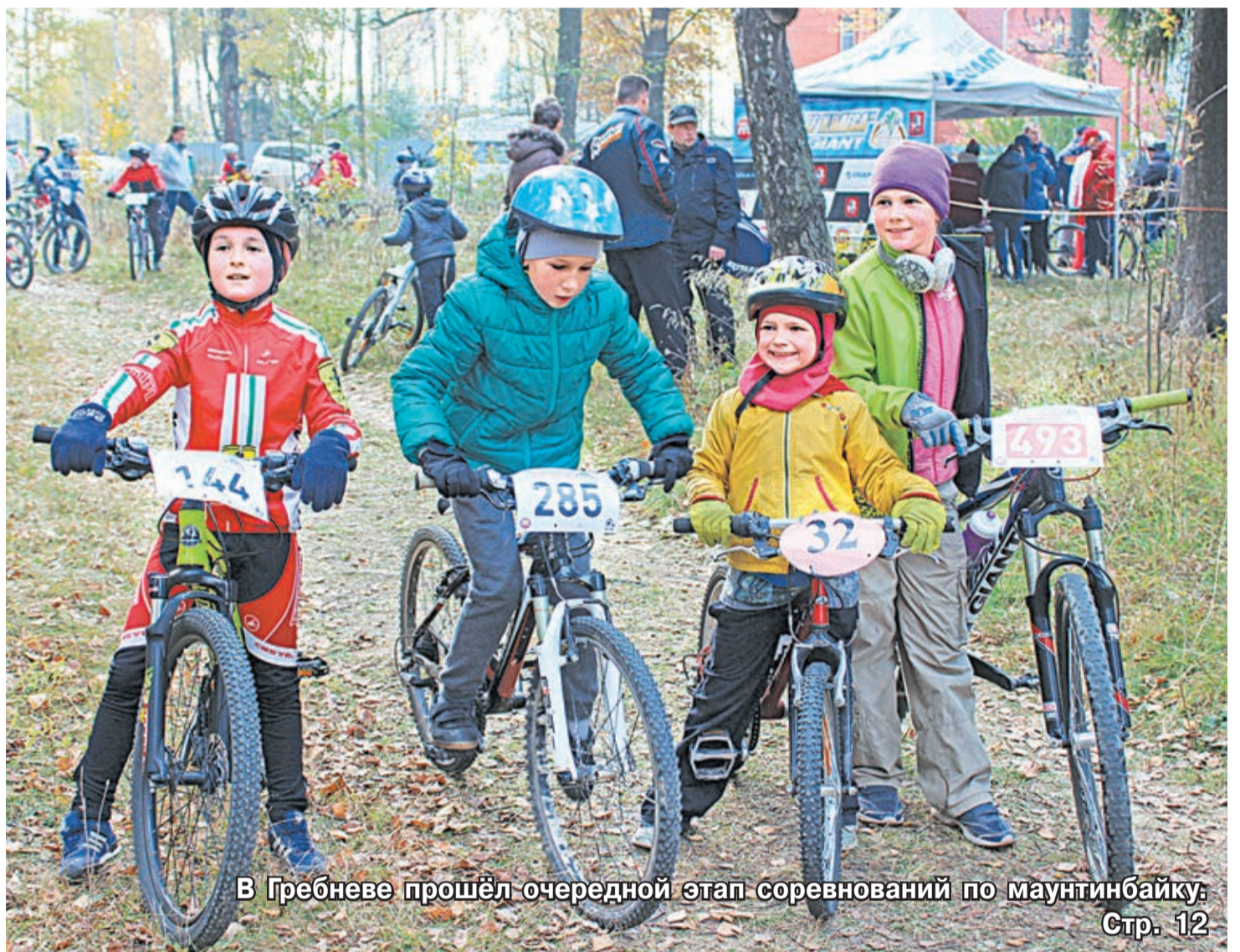
В Гребневе прошёл очередной этап соревнований по маунтинбайку. Стр. 12

призывника из Щёлковского района отправились к местам несения службы