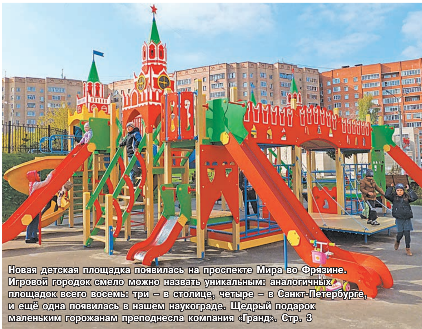
Новая детская площадка появилась на проспекте Мира во Фрязине. Игровой городок смело можно назвать уникальным: аналогичных площадок всего восемь: три – в столице, четыре – в Санкт-Петербурге, и ещё одна появилась в нашем наукограде. Щедрый подарок маленьким горожанам преподнесла компания «Гранд». Стр. 3

человек стали гостями Дня пожилого человека в ДК «Факел»