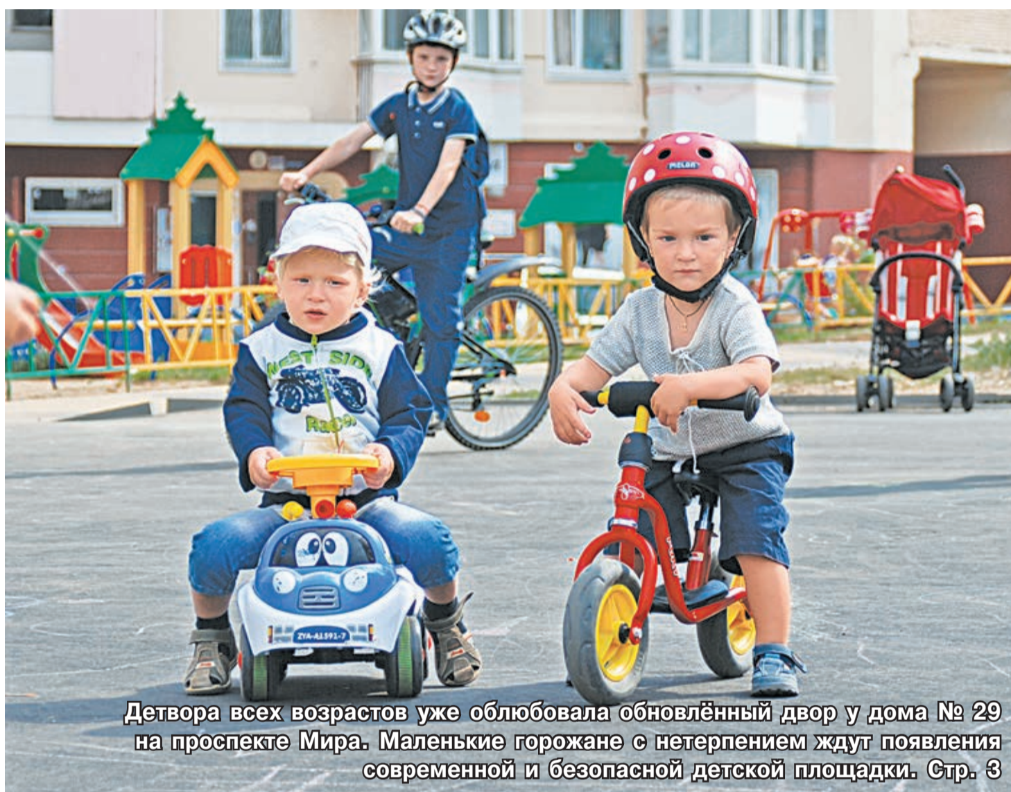
Детвора всех возрастов уже облюбовала обновлённый двор у дома № 29 на проспекте Мира. Маленькие горожане с нетерпением ждут появления современной и безопасной детской площадки. Стр. 3

полицейских района задействуют на выборах