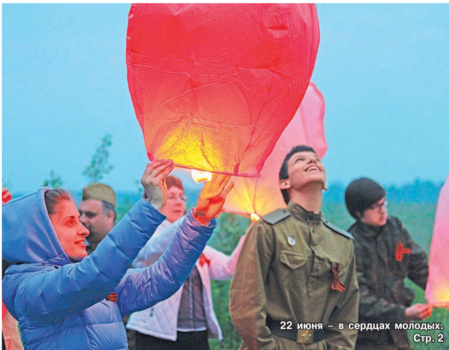
22 июня – в сердцах молодых. Стр. 2

фрязинских выпускников окончили школы с медалями