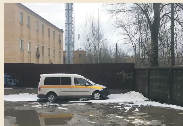
● Вместо проезда – забор.

«Надо выходить на область и писать обращение губернатору с приложением ответа из нашей администрации и Щёлковской