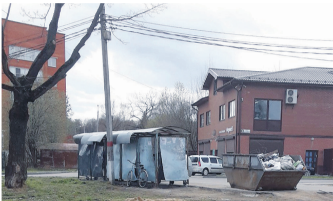
Та самая контейнерная площадка.