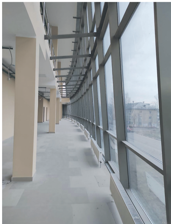
«Я бы сама сюда переехала», – сказала директор Губернской библиотеки про помещение на Комсомольской улице.

общил, что некоторое время назад был подготовлен проект по обустройству этой площади под библиотеку. Но потом помещение начали готовить под детский сад. Теперь надо обновить проектную документацию.