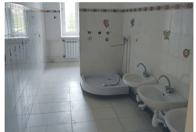
Помещение на Пионерской, 1 в стадии ремонта под детсад. Сегодня во Фрязине острая нехватка мест в ДОУ.

Хочется спросить в манере современной молодёжи: в смысле? То есть деньги на ремонт помещения под детсад – бюджетные