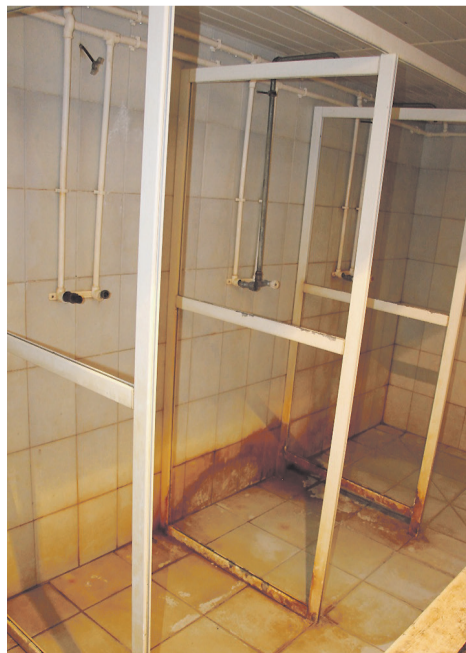
Первый этаж общежития и душевые – после капремонта.