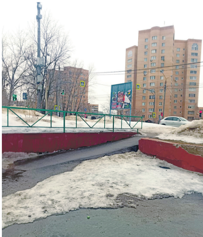
● У пандуса нет поручня. Коляска может упасть.