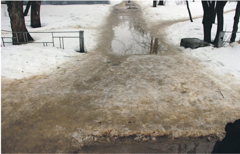
● Ступени с Московской улицы к городской поликлинике превратились в ледяную горку.

В этот раз не вышло: тротуар за перекрёстком вновь не поддался