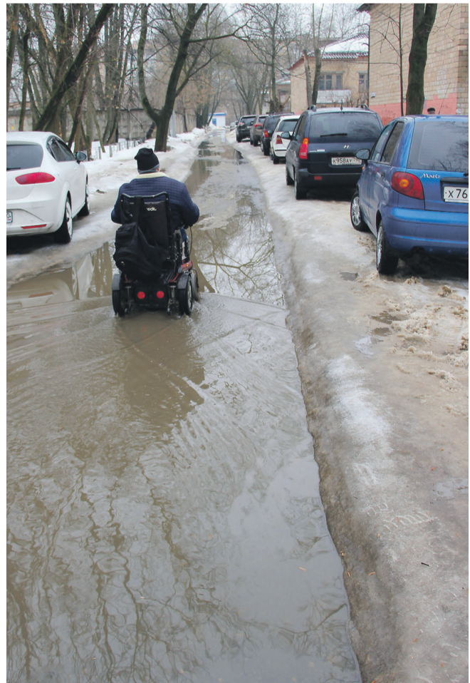
● По проезду Гольца почти влпавь.