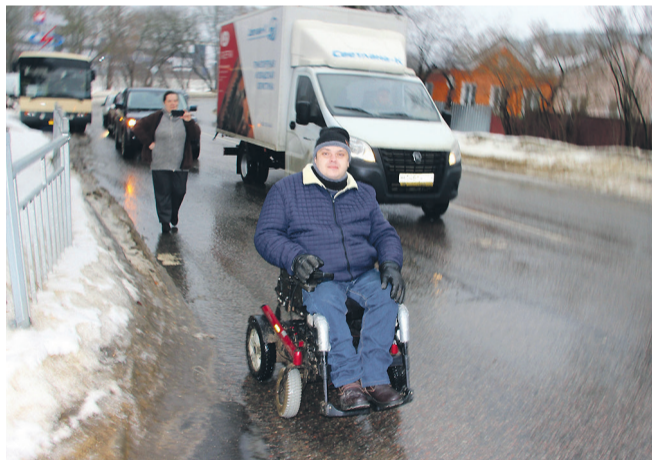
● На тротуар заехать невозможно: лёд. Движемся по проезжей части Московской улицы.