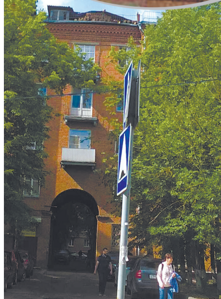
● Вокзальная, 19. Крышу разобрали – и оставили. Июль, 2019 год.