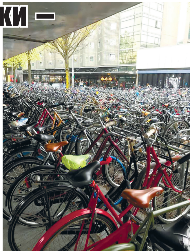
● Перехватывающая велопарковка у вокзала в Амстердаме. На нескольких этажах ежедневно оставляют велосипеды те, кто работает в других городах. На улицах голландской столицы самые популярные парковки — велосипедные.

Дорога в лавру — это 120 километров через самые красивые места Московской области. В Пушкинском городском округе администрация предложила на участке, через который проходит тропа, организовать спортивный комплекс. Чиновники увидели, что здесь поток проезжающих насчитывает десятки тысяч человек. Продвижение этого места