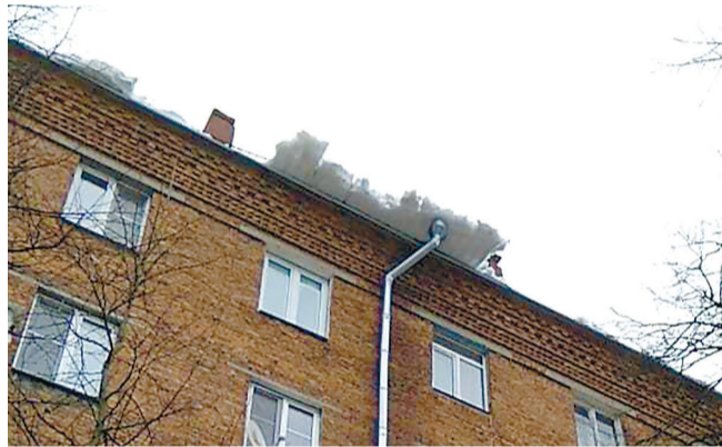
● Снежные лавины с крыши дома 19 Вокзальной улицы.

Дождь кончился, смыв следы ремонта в квартире Ольги Николаевны. В двух залитых комнатах на потолке вздыбилась побелка, на полу – ламинат, на стенах – обои. Забегая вперёд, скажем,