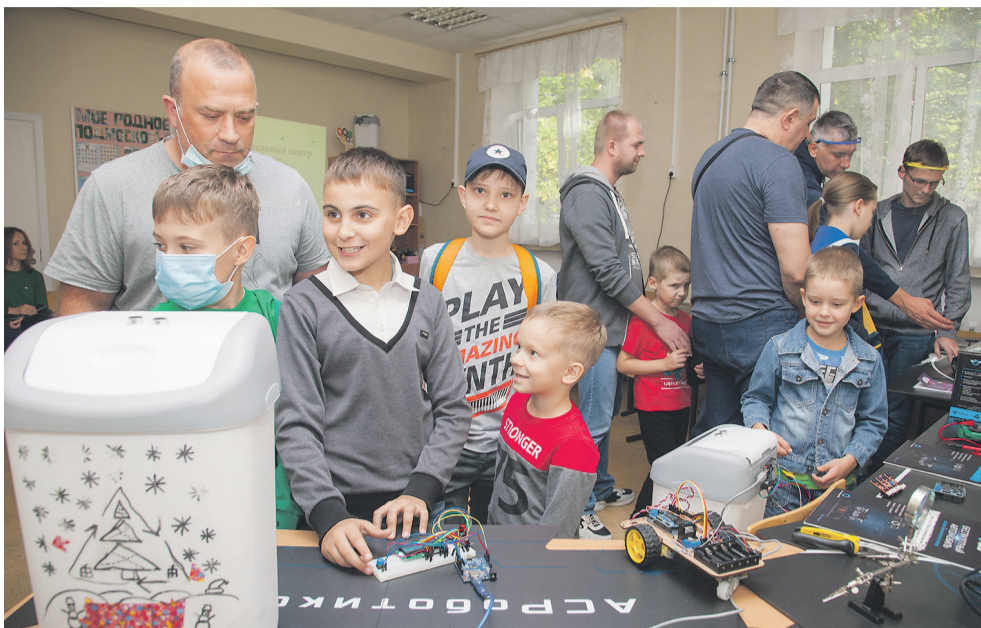
● У ребят горят глаза.