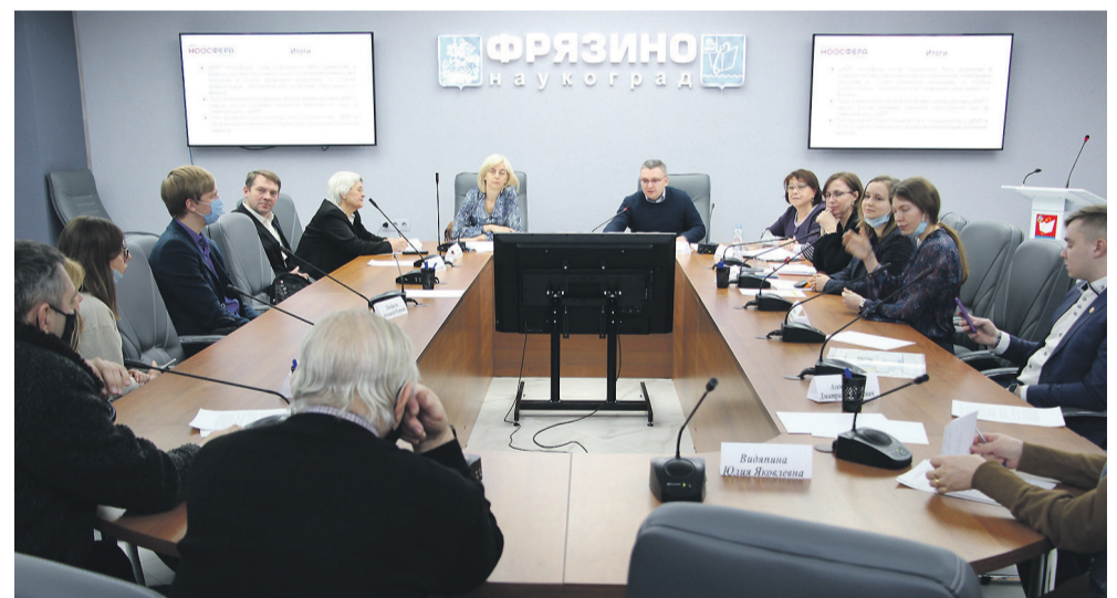
● Круглый стол по развитию стратегии наукограда, организованный Общественной палатой.