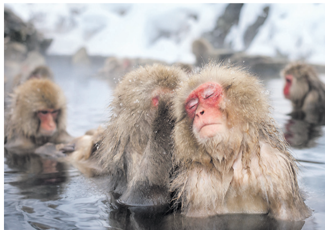
Японские макаки зимой любят спать в термальных источниках.