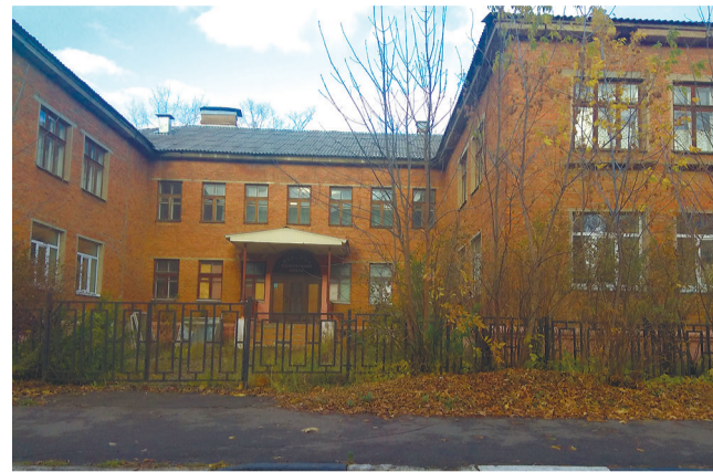
Что ждёт «Буратино»?

Но администрация не постеснялась объявить родителям, что ясельки из аварийного пятого сада (к сентябрю он впервые набрал две ясельные группы) переезжают в первый дом. В многоэтажке общая система отопления. Чтобы саду соблюсти свой норматив по теплу – 70 градусов на выходе, – всему дому придётся устроить Ташкент. А уж в какие расходы это выльется жите-